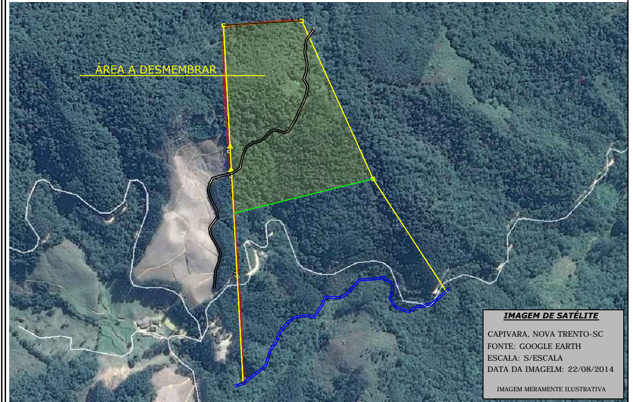
IMAGEM DE SATÉLITE CAPIVARA, NOVA TRENTO-SC ESCALA: S/ESCALA DATA DA IMAGEM: 22/08/2014 IMAGEM MERAMENTE ILUSTRATIVA